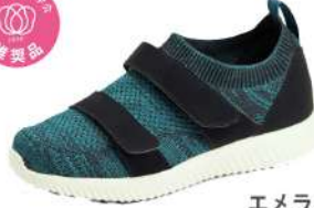
エメラルドグリーン