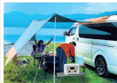
車中泊やアウトドアに