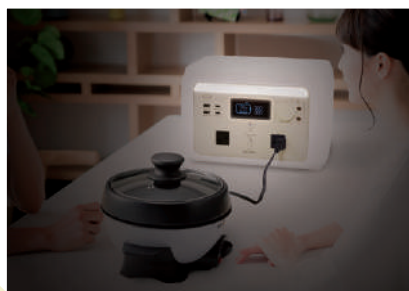
停電時や災害時に