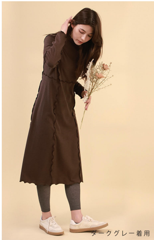
ダークグレー着用