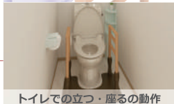
トイレでの立つ・座るの動作