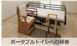
ポータブルトイレへの移乗