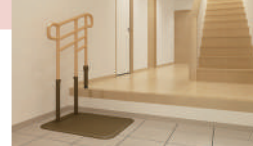
あがりかまちを昇る・降りる

[H型]あがりかまち高さ:18~36cm [L型]あがりかまち高さ: 4~18cm