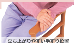
立ち上がりやすい手すり位置