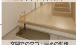
玄関での立つ・座るの動作