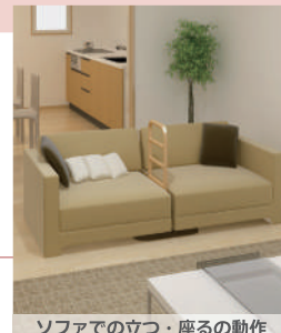
ソファでの立つ・座るの動作