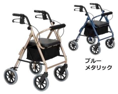
ブルー メタリック