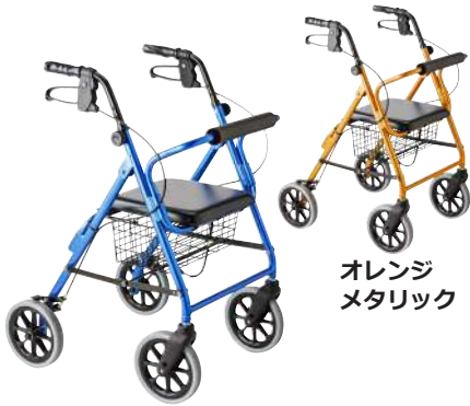
オレンジ メタリック