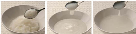
7分粥 ジャムぐらい 5分粥 ヨーグルトぐらい 3分粥 ポタージュぐらい