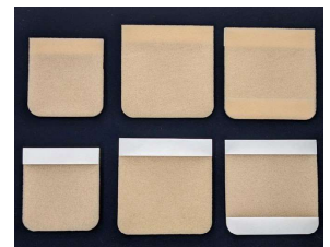
気管孔保護フィルター （1袋 10枚入り）