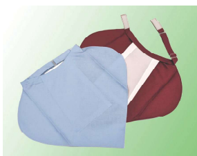
ネックカーチーフタイプエプロン