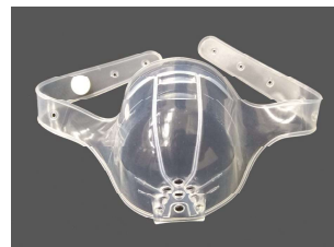
シャワーガード® （シャワー時専用 患部保護具）