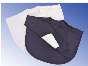
Tシャツタイプエプロン