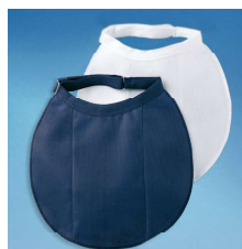
メッシュエプロン