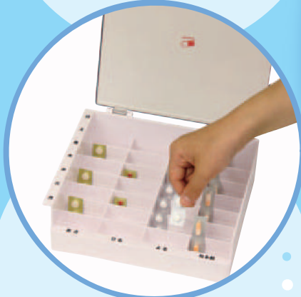
HEC03 テイコブMyカルテ くすり整理キーケース

Tacaofから新しく薬入れブランド「Myカルテ」が誕生!健康管理には毎日の正しいお薬の服用が大切です。ご自身のカルテとして、お薬を一目で分かりやすく管理し健康に過ごして頂けるようお願いを込めてブランドを立ちあげました。