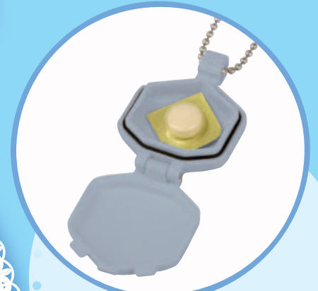
HEC02 テイコブMyカルテ くすり携帯ペンダントケース