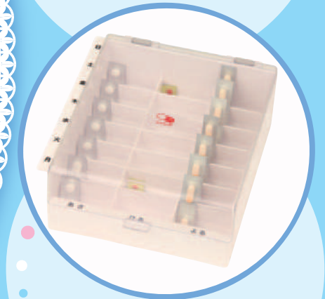
HEC04 テイコブMyカルテ くすり整理ボックス