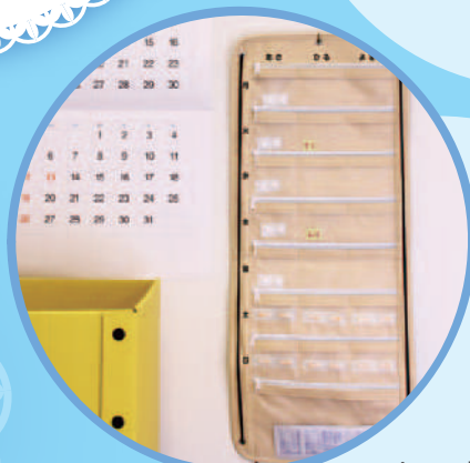
HEC06 テイコブMyカルテ くすり整理トラベルバッグ