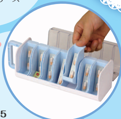
HEC05 テイコブMyカルテ くすり整理キャリアケース