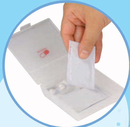
HEC01 テイコブMyカルテ くすり携帯スリムケース