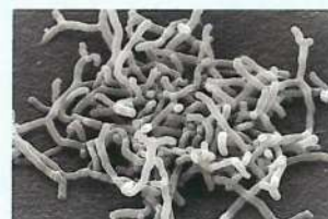
Bifidobacterium longum BB536 (ビフィドバクテリウム ロンガム BB536)

ビフィズス菌BB536は健康な乳児から発見された“ヒト由来”のビフィズス菌です。1969年に発見されて以来、世界中から多くの生理機能が報告されています。